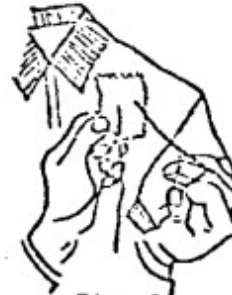
Fig. 2 Aquí la aguja vuelve en sentido contrario y atraviesa nuevamente la estampilla a medio ca. aproximadamente de la pasada anterior.