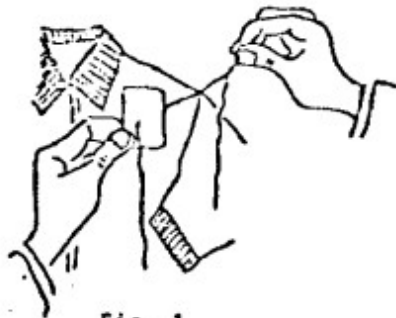
Fig. 1 La aguja pasa por el punto medio del reverso de la estampilla hacia la prenda tomándola con una puntada.