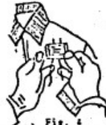
Fig. 4 Enseguida se pega la estampilla doblándola sobre sí misma.