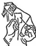
Fig. 2 Aquí la aguja vuelve en sentido contrario y atraviesa nuevamen- te la estampilla a medio ca. a- proximadamente de la pasada an- terior.