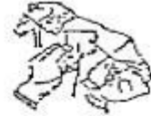
Fig. 2 La aguja vuelve en sentido contrario y atraviesa nuevamente la estampilla a medio centímetro o aproximadamente de la pasada anterior.