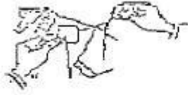
Fig. 1 La aguja pasa por el punto medio del reverso de la estampilla hacia la prenda, tomándola con una puntada.

deberá obstruir la visualización de la marca, modelo u otra característica relevante del producto.