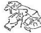
Fig. 2 La aguja vuelve en sentido contrario y atraviesa nuevamente la estampilla a medio centímetro aproximadamente de la pasada anterior.