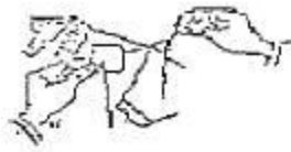
Fig. 1 La aguja pasa por el punto medio del reverso de la estampilla hacia la prenda, tomándola con una puntada.

La estampilla se colocará en el envase inmediato exterior en que se lo acondicionó para la venta minorista en plaza, recubierta con cinta transparente en forma vertical y horizontal, teniendo en cuenta que las uniones finales de las cintas coincidan en un solo extremo, de manera tal que sea imposible extraer el contenido sin provocar la destrucción del elemento fiscal. La estampilla no deberá obstruir la visualización de la marca, modelo u otra característica relevante del producto.